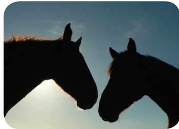
C.FELTESSE - IFCE

Les tarifs que propose l'ATM Equidés – ANGEE sont mutualisés et permettent d'optimiser le coût de l'équarrissage en fonction de type d'équidé et de la région où doit se faire l'enlèvement.